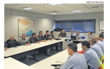
Moment de la reunió, el 29 de gener