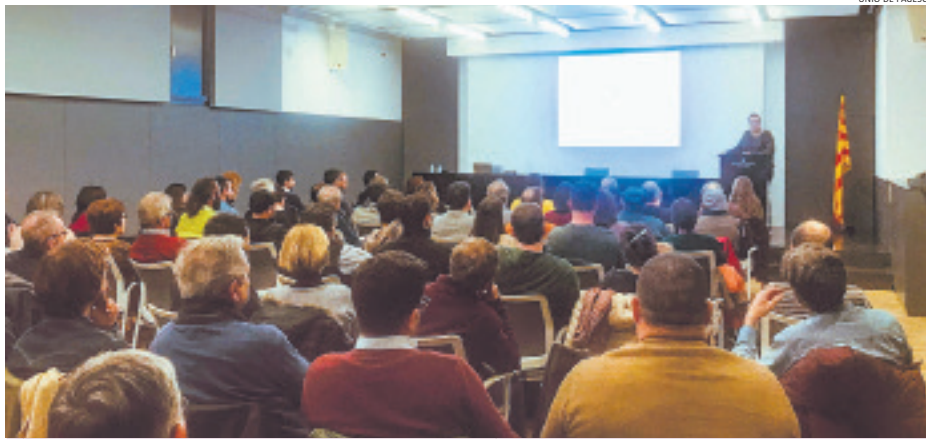
L'estudi es va presentar en un acte del Departament d'Agricultura a Tortosa el 29 de gener