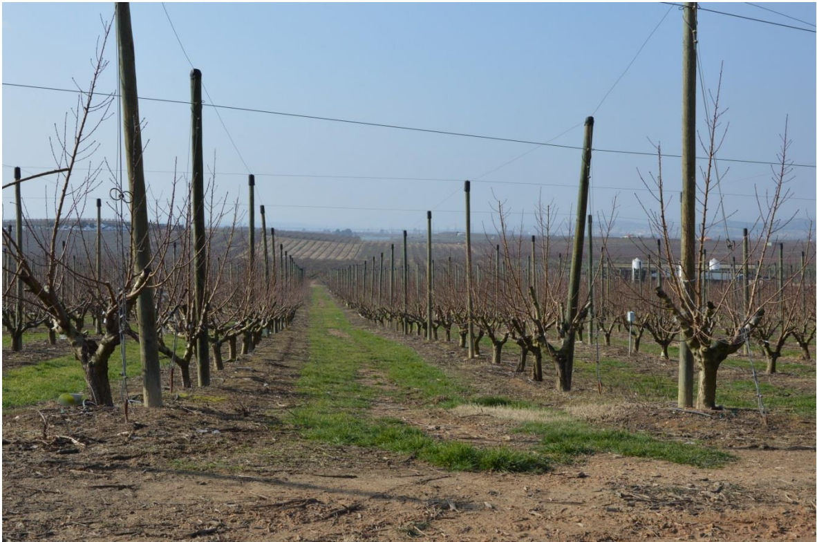
Camp de fruiters als voltants de Lleida.