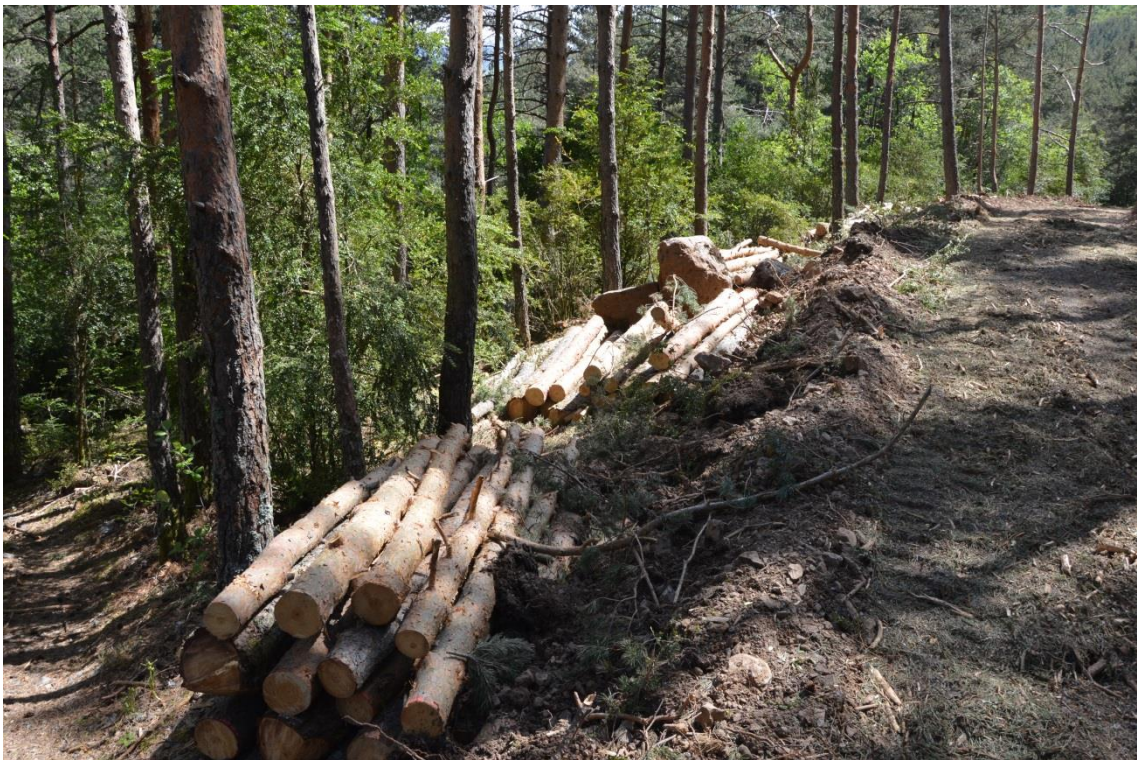
Explotació silvícola a l'Alta Ribagorça.