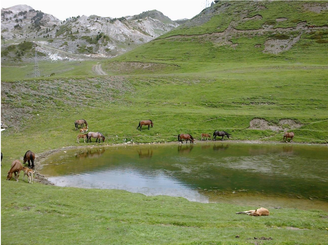
Zona de pastures al Port de la Bonaigua.