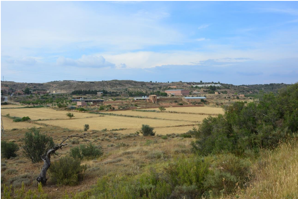
Mosaic mediterrani a Torrebesses.

També s'ha aportat al GTEA un glossari de conceptes relacionats amb l'espai agrari i l'activitat agrària (recollit a l'apartat 4 del present document), un recull de documents de referència (recollit a l'apartat 5) i les contribucions fetes des de diverses disciplines (recollides a l'apartat 6). Tota aquesta documentació es completa amb una bibliografia.