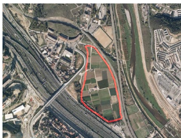
Figura 1: imatge aèria actual dels horts de la finca de la Ponderosa (font: GoogleEarth).

S'ha de reconèixer que l'oportunitat era magistral, doncs sorgia la possibilitat d'equipar Barcelona d'un