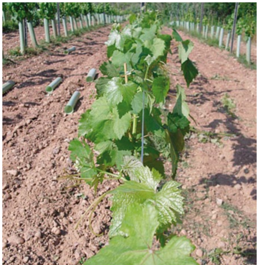
El proper setembre s'obtindrà la primera collita de la varietat de Picapoll.

Els somnis, però, no s'esgoten sinó que creixen i el projecte és avui només una part del que serà. Donem voltes, doncs, a tenir un celler propi, a la interessant amalgama d'unir agricultura i treball social i a l'observació meticulosa d'aquests ceps nous, que procurarem que facin transmetre al futur vi tota la força del paisatge del Parc Natural, tota l'herència del treball amb la terra dels antics camps conreats de Sant Llorenç, tota la tendresa dels amants de l'agricultura i tota la saviesa de l'ofici del pagès, amb l'experiència i recursos dels enòlegs d'avui.