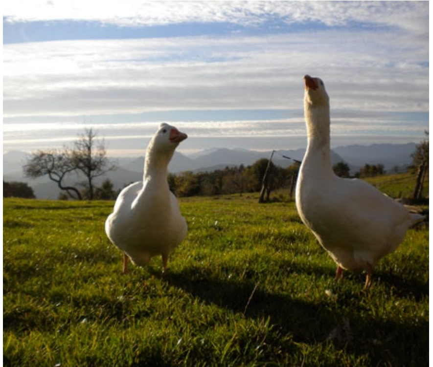
Un dels projectes en els quals s'està treballant és en la recuperació de l'Oca de l'Empordà a Sales de Llierca.

-133 Gallines Nana Flor d'Ametller: Aquestes petites gallines són imprescindibles