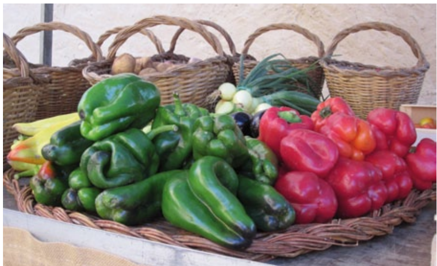
El mercat ecològic de Sant Martí Vell el podeu trobar cada segon dissabte de mes a la plaça del poble.

El nostre mercat és el primer de Catalunya amb tres anys de vida, i el trobareu cada segon dissabte de mes a la plaça del poble, amb excepció dels mesos de juliol i agost. S'hi pot trobar de tot: aliments, estris per a la llar i la possibilitat de fer un bon esmorzar. Tots els nostres marxants tenen el segell del Consell Català de Producció Agrària Ecològica (CCPAE) vigent o factures de tot allò que manipulen amb el corresponent segell obligatori. És organitzat per l'Ajuntament de Sant Martí Vell amb la gran ajuda i els suggeriments dels marxants i, a més, hem comptat amb el suport del Departament d'Agricultura i Ramaderia de la Generalitat, de la Diputació de Girona i del Consell Comarcal del Gironès.