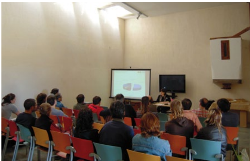
Presentació de l'Espai de Gallecs (Vallès Oriental) a la jornada-taller de custòdia agrària a l'Empordà, organitzada per IAE-DEN el 16 de maig a l'Ecomuseu-farinera de Castellò d'Empúries.