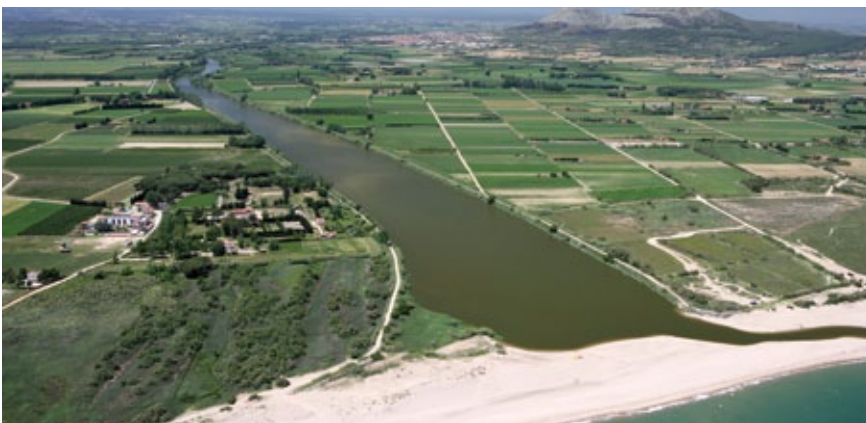
Panoràmica de l'espai agrari del Baix Ter

La figura d'espai d'interès agrari és del tot compatible amb la resta de qualificacions sectorials que tingui o pugui tenir el territori i no vol, en cap cas, contraposar-se al Parc Natural del Montgrí, les Illes Medes i el Baix Ter. Ans al contrari: són dues figures que es complementen i que són una oportunitat de futur per al desenvolupament econòmic local.