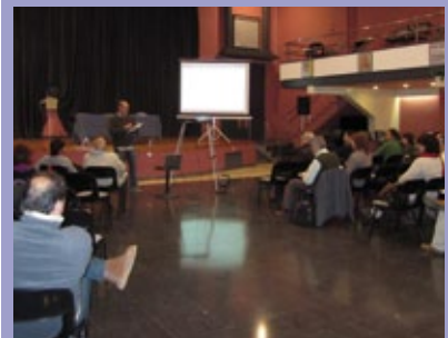
Un moment de la tercera sessió del Fòrum Permanent.

La necessitat de conservació del territori i la voluntat de dur a terme projectes de desenvolupament local basats en el turisme van dur el Parc Natural del Montseny a impulsar la implantació de la Carta Europea de Turisme Sostenible (CETS), avalada per la Federació europea EUROPARC. Per això es va crear un Grup de Treball i un Fòrum Permanent. Durant aquest any, s'ha realitzat una diagnosi del territori -en termes de turisme, conservació i repercussions d'aquestes activitats en la població i en l'economia local- a partir de la qual s'ha definit una estratègia de turisme sostenible, document que van aprovar les més de 40 persones participants en la tercera sessió del Fòrum Permanent. Els assistents, que representaven el Parc Natural del Montseny, el sector turístic privat, entitats d'educació ambiental, consorcis i administracions de promoció turística, propietaris forestals i centres i museus d'interpretació, van treballar també en el Programa d'Actuacions que desenvolupa l'estratègia aprovada i que consta de 50 actuacions que fan palpable la implantació d'un model de turisme sostenible al Montseny.