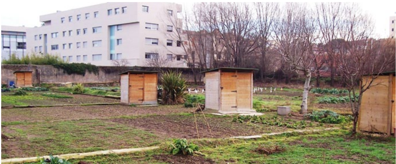
A les hortes de Santa Eugènia es potencia el conreu ecològic.

En aquest sentit, cal procurar unes garanties mínimes de rendiment de la producció que permetin a la iniciativa privada apostar de nou per la recuperació d'aquesta mena d'espais. Així doncs, l'administració ha de promoure iniciatives i donar suport a la seva aparició, però difícilment podrà vetllar amb recursos propis per la preservació dels valors ambientals i paisatgístics.