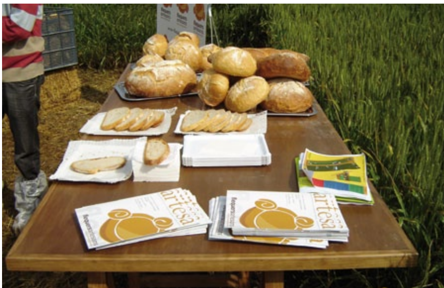
Presentació del projecte en el marc de la IX Jornada Intercomarcal sobre cultius herbacis.

El pa serà el primer element que introduirà el concepte d'una marca territorial que posi en valor la conservació dels ecosistemes, els productes agraris de qualitat i l'excel·lència dels nostres pagesos que, a través del seu treball quotidià, ens permeten gaudir d'uns espais oberts d'extraordinària bellesa.