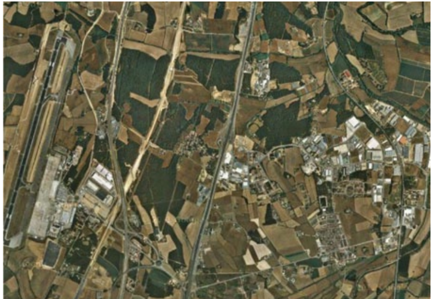
Vista aèria de l'espai agrari periurba al sud de Girona, travessat d'esquerra a dreta per l'Aeroport de Girona, CIM Selva, AP-7, A-2, i el tren a Riudellots.

En la Carta es constata la realitat dels espais agraris periurbans i es marca com a objectiu fonamental la consecució del reconeixement de les especificitats de les zones agrícoles periurbanes i de la relació ciutat-camp. Es proposa que els municipis