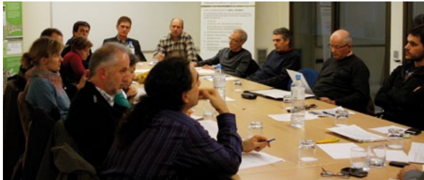
La reunió d'alcaldes va tenir lloc a la seu del CILMA.

Pel que fa al Pacte d'Alcaldes, són tres els municipis de les comarques gironines que ja l'han signat: Figueres, Girona i Ordís. Dos ajuntaments més estan a punt de fer-ho: Santa Cristina d'Aro i Castell-Platja d'Aro.