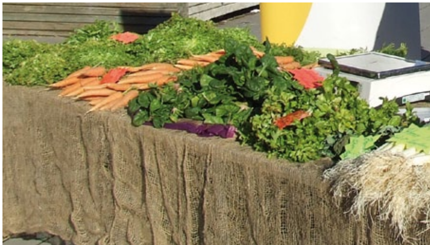
Mercat de productors ecològics per una venda sense intermediaris.

Un altre cas és el que estem realitzant a JARC-COAG amb l'Agricultura de Responsabilitat Compartida (ARCo). És una aposta comú entre pagesos i consumidors per establir nous vincles i relacions de confiança entre ambdues parts. ARCo promou les relacions directes i estables entre els agricultors i els consumidors a través de canals curts de comercialització.