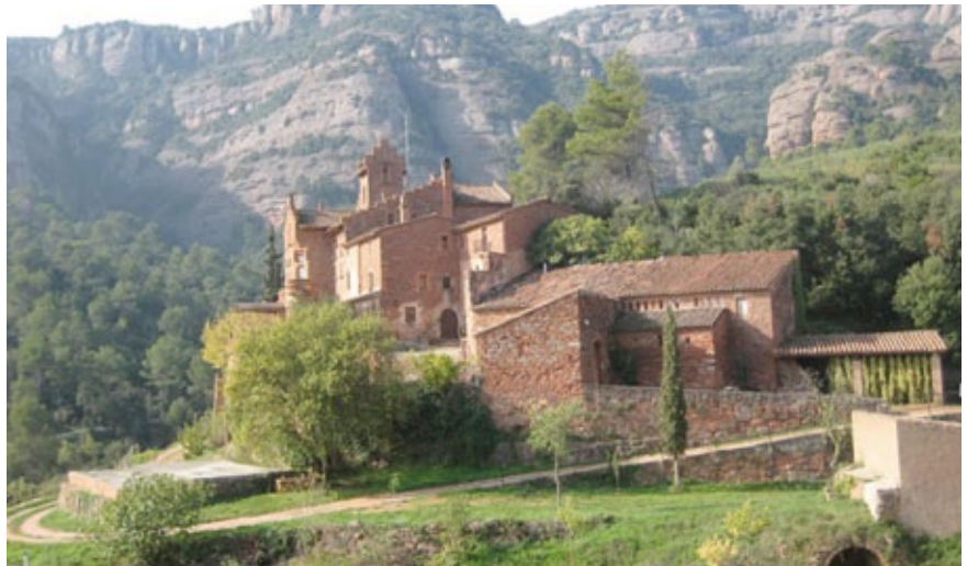
Una imatge de del Marquet de les Roques, a la Vall d'Horta.

En aquest aspecte, poc a poc anem generant jornades de formació, itineraris i tallers a la mateixa Masoveria del Marquet de les Roques que aquest any