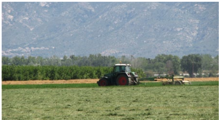
Espai agrari. Parc Natural dels Aiguamolls de l'Empordà.

El 14 d'abril de 2010 es va celebrar el debat general del sector agrari al Parlament de Catalunya que va concloure amb el compromís de promoure un Pla Estratègic Nacional de suport a l'Agricultura i l'Alimentació. Entre d'altres acords, es van pronunciar a favor del manteniment dels espais agraris i de l'elaboració d'un projecte de Llei d'Espais Agraris que en faci una definició jurídica i que assumeixi els compromisos de gestió, preservació, ordenació i desenvolupament d'aquests espais així com un Pla sectorial d'espais d'interès agrari. Amb el canvi d'any i l'inici de la nova legislatura tenim sobre la taula tots els arguments i eines, ara només fa falta posar en marxa tota l'enginyeria política perquè es resolgui definitivament una qüestió quasi oblidada.