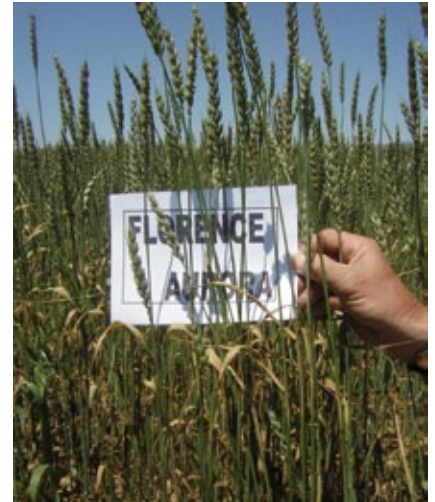
Blat varietat Florence Aurora.

En la fase actual del projecte ja s'ha establert que els blats que es cultivaran seran Anza i Florence Aurora i s'està po-