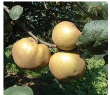
Imatge d'una poma terrera.

de qualitat que vénen enfortides per la seva vinculació històrica i territorial. Amb una bona estratègia i planejament es pot arribar a beneficis econòmics directes i a aconseguir que les varietats tradicionals de fruiters tornin a estar presents en els mercats locals. Només cal proposar-s'ho. El consumidor ho agrairà.