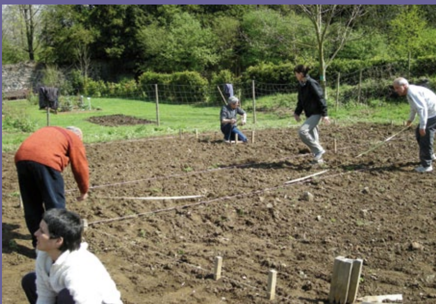
Participants de la 4a edició del curs "Planta't a l'hort!"

El Centre per a la Sostenibilitat Territorial es va crear el 2006 per promoure una "nova cultura del territori", és a dir, una nova manera d'entendre i d'entendre's amb el territori. L'associació uneix entitats ambientals i moviments en defensa del territori, professors i investigadors universitaris, agents econòmics i professionals, i ciutadans en general. El CST ha iniciat la seva activitat a les comarques gironines, com a espai natural i social de molts dels seus socis, i la seva seu està a Sant Privat d'en Bas (Garrotxa).