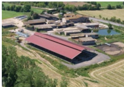
Mas Gener, explotació de vaca de llet al periurbà sud de Girona.

El Pla territorial parcial de les comarques gironines classifica el 10% de sòl no urbanitzable com a possible futur urbà, és a dir, reservori de sòl per a interessos urbanístics. Això afecta al 25% de les lleteres, ja que es troben properes a una d'aquestes àrees.