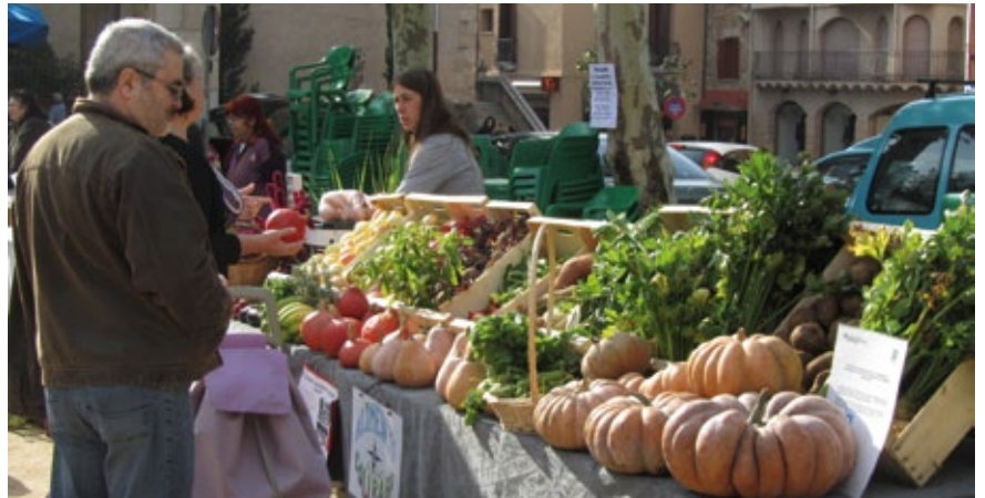
Mostra de productors a Sta. Coloma de Farners. 23 d'octubre de 2010.

lies: els horts de Ca l'Emys (Riudarenes).