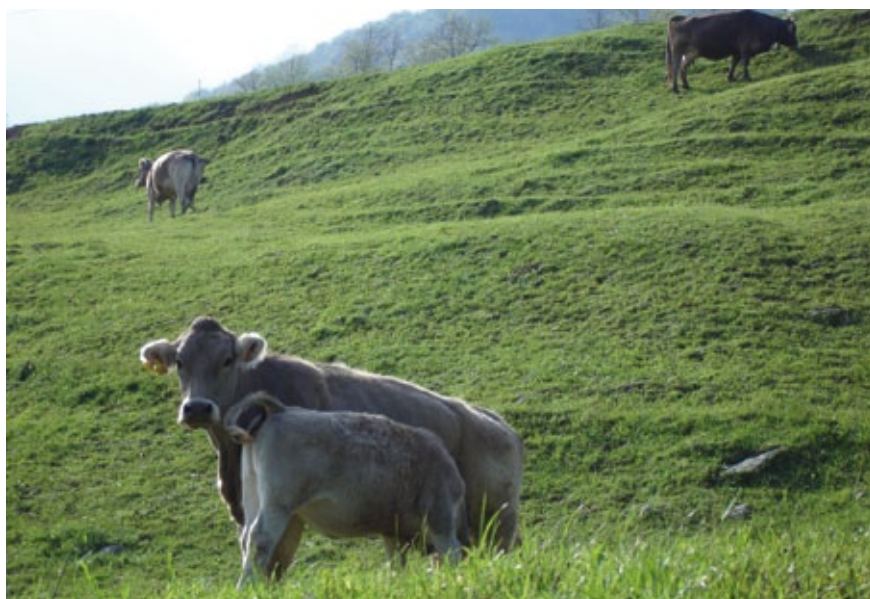
Brunes dels Pirineus pasturant a Sant Pau de Segúries.

Es treballa per uns models de producció i consum enfocats cap a un sector agrari respectuós amb el seu entorn i socialment més sensible que respecta la sostenibilitat. La iniciativa afavoreix la recuperació del consum de productes més casolans, locals i de temporada i, per tant, el desenvolupament de l'economia local.