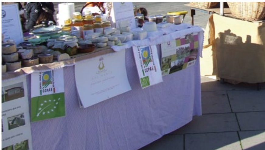
El mercat ecològic de la plaça del Lleó de Girona se celebra cada dijous.