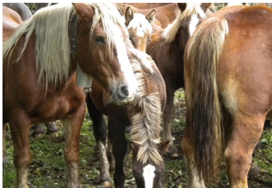
L'Associació de criadors d'eugues de muntanya del Ripollès ven la carn de poltre directament al consumidor.

Un altre exemple d'accions municipals més concretes és la creació d'un Parc Agrícola a Vilajuïga per recuperar els antics valors ambientals i agraris de les 146 Ha del terme municipal incloses dins el PN de Cap de Creus. Es recuperaran 10 Ha d'olivera, 1,5 Ha de vinya i 1 Ha de fruiters i plantes aromàtiques. També es farà una nova prova pilot amb cabres per recuperar pastures en unes 70 Ha de la zona.