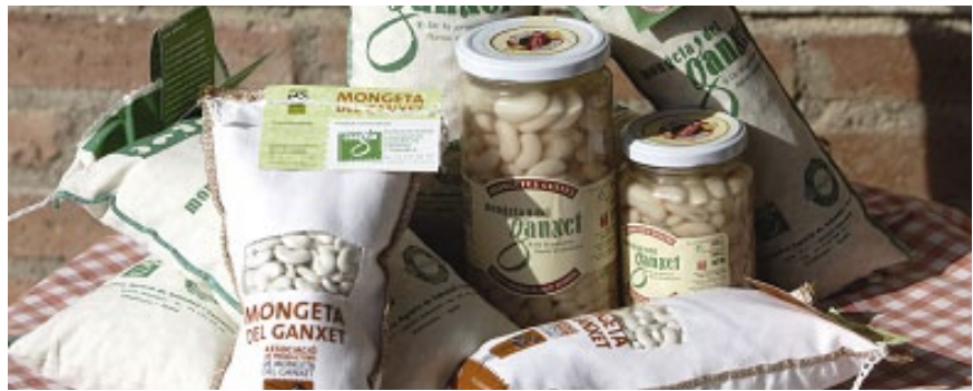
Productes del Parc Agrari de Sabadell.

El paisatge mosaic i l'agricultura periurbana —així és com hem de catalogar aquesta